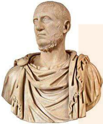
Publi Corneli Tàcit (ca. 55 – 120 dC)

De família eqüestre. Va ser un funcionari imperial que tingué fama per la seva eloqüència. Tàcit ens ha deixat el relat de les èpoques vergonyoses i sanguinolentes del primer segle de l'Imperi. Es va proposar narrar els esdeveniments que van precedir immediatament la seva època, és a dir, l'evolució del sistema del Principat creat per August, l'exaltació del poder personal que va tenir lloc sota els seus successors i la progressiva desaparició de la influència política del Senat.