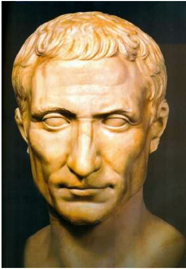
Gai Suetoni Tranquil (75 – 160 dC)

Secretari de l'emperador Adrià, va ser un infatigable lector d'arxius i biblioteques. S'ha perdut bona part de les seves obres.