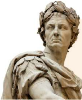
Gai Juli Cèsar (101 aC – 44 aC)