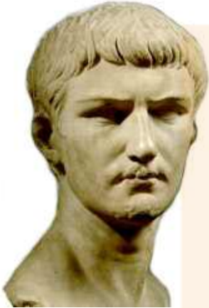
Corneli Nepos (ca. 100 – 29/25 aC)