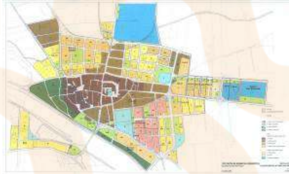
PGOU DE SANT PERE PESCADOR, 2006