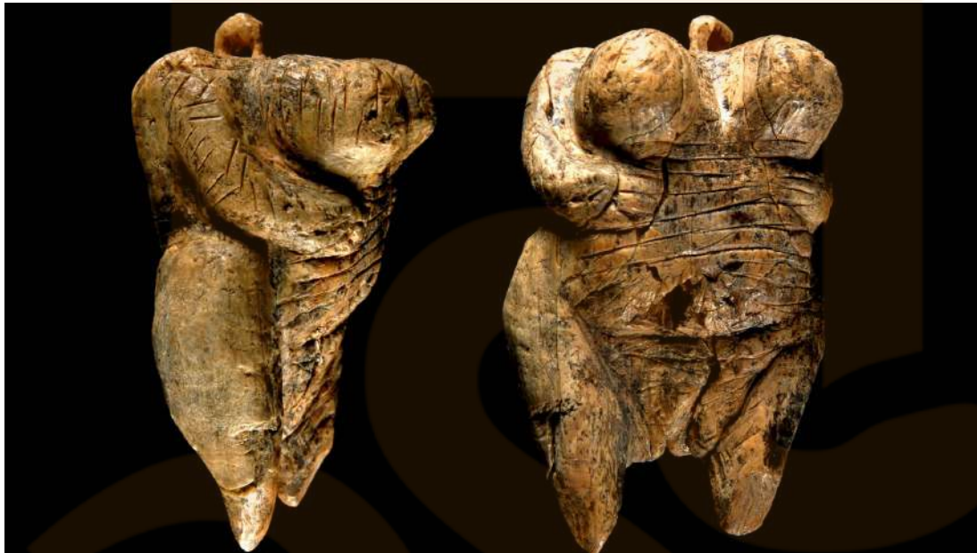
Figura 3: Venus de Hohle Fels

àmplia franja d'Europa (especialment el sud de França, el nord d'Espanya i Suàbia, a Alemanya) inclouen més de duescentes coves amb espectaculars pintures, dibuixos i escultures aurignacianes que són els primers exemples indiscutibles de la representació d'imatges. La més antiga d'aquestes és una figura femenina de 6cm tallada en ivori de mamut que és va trobar en sis fragments de la cova d' Hohle Fels , a prop de Schelklingen, al sud d'Alemanya, d'una antiguitat aproximada de 35,000 anys a.C.