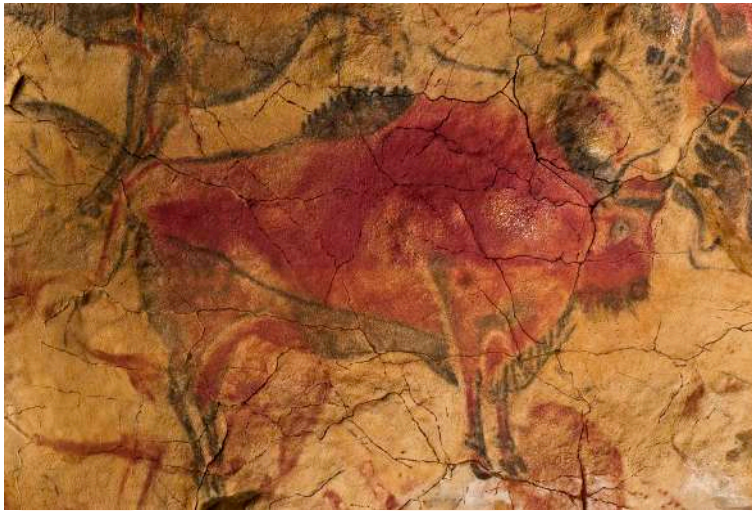
Figura 5: Altamira

la benvinguda a 250.000 persones l'any passat.