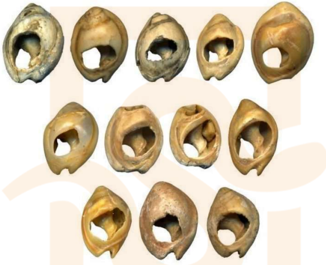
Figura 2: Nassari gibbosulus perforats de capes arqueològiques datades entre 73.400 i 91.500 a.C. a les coves de Taforalt, al Marroc.

antic és una col·lecció de petxines de caragol Nassarius de 82.000 anys trobades al Marroc que estan perforades i cobertes amb ocre vermell. Els patrons de desgast suggereixen que poden haver estat perles enfilades. En la cova de Blombos a Sud-àfrica, s'han trobat petxines perforades i petits trossos d'ocre ( Haematite vermell) gravats amb patrons geomètrics simples en una capa de sediment de 75.000 anys d'antiguitat.