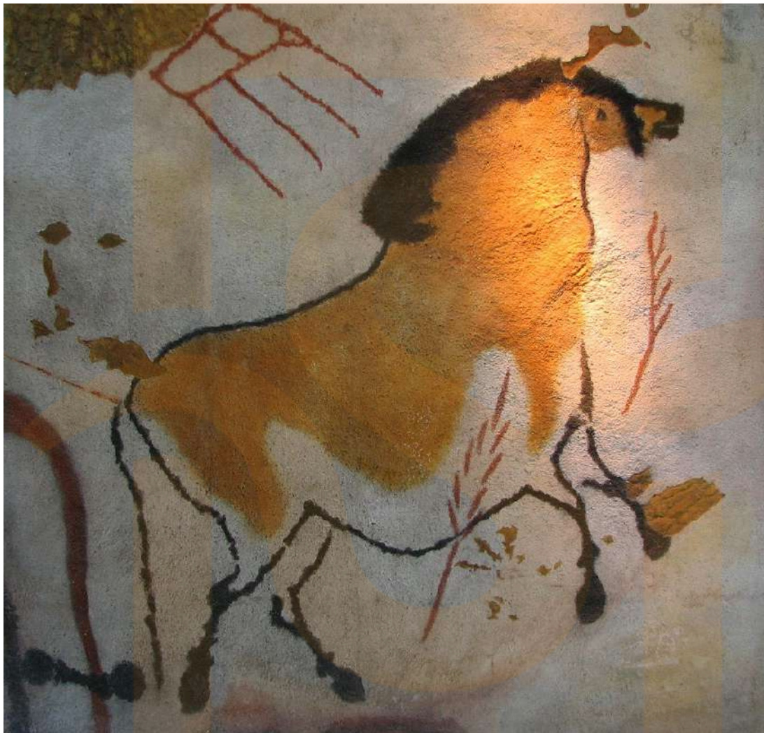
Figura 9: Rèplica de les pintures de Lascaux al museu Anthropos de Brno.

que funcionen com a perfectes “lones blanques” per dibuixar i pintar. Les pintures de Lascaux estan realitzades partint de materials de carbó i ocre terra, pigments extrets de la zona dels quals, barrejats amb líquids, podien aconseguir una certa varietat cromàtica (marró, vermell, groc i blanc). Les imatges que predominen en la cova són escenes on representen animals (cavalls, cérvols, bisons, un rinoceront...), gairebé com si fos una sort d'enciclopèdia de la fauna de la zona.