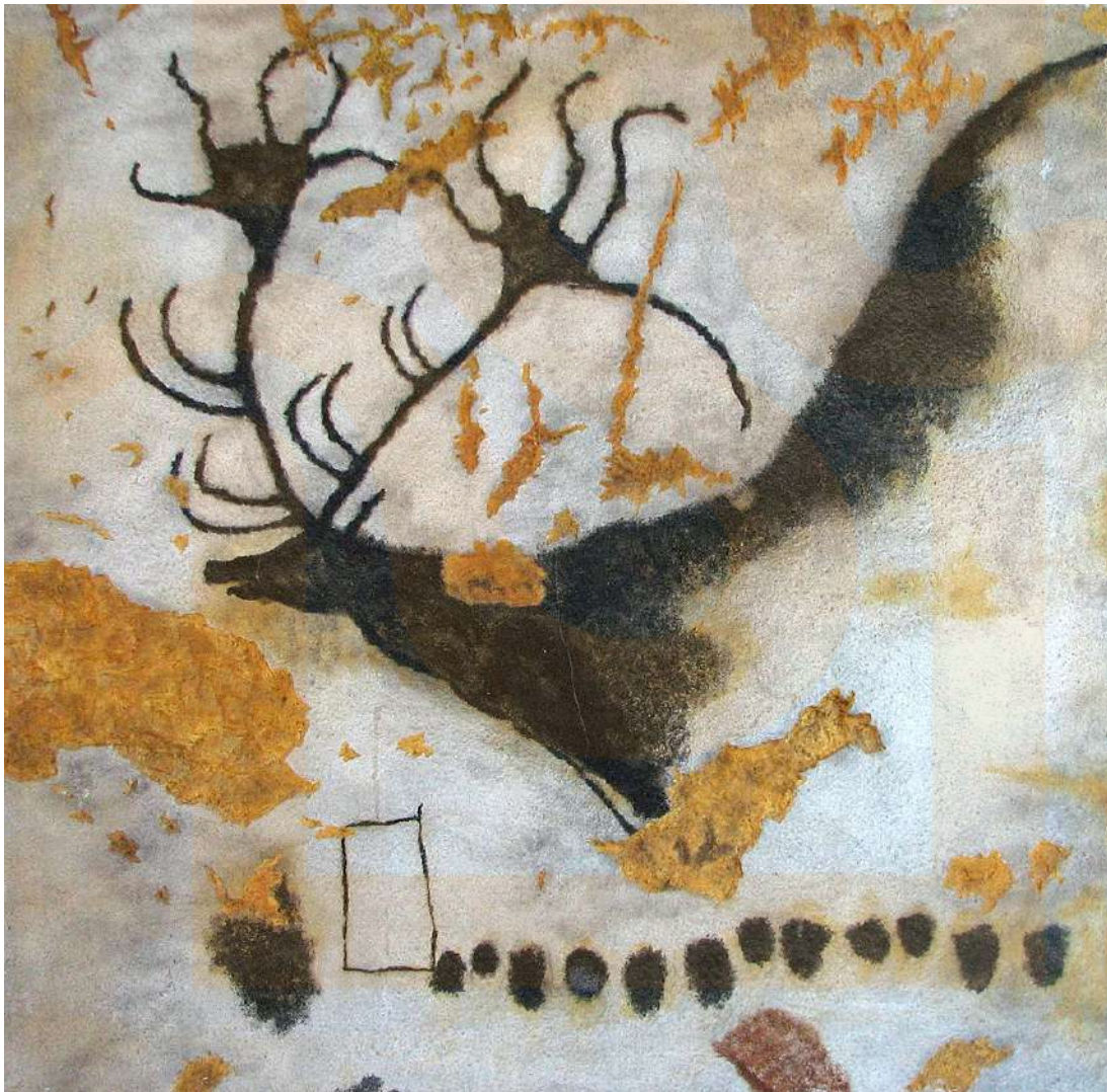
Figura 8: Una pintura del cérvol gegant de Lascaux.

Una altra fita històrica dins del marc de les pintures rupestres la trobem a la cova de Lascaux, França. Penseu que, com la cova d'Altamira i Lascaux, hi ha 350 llocs similars on es té constància de manifestacions artístiques d'aquesta època de la humanitat. No podem parlar d'una connexió entre les coves descobertes: la majoria són llocs aïllats distribuïts per la regió del sud de França i el nord d'Espanya.