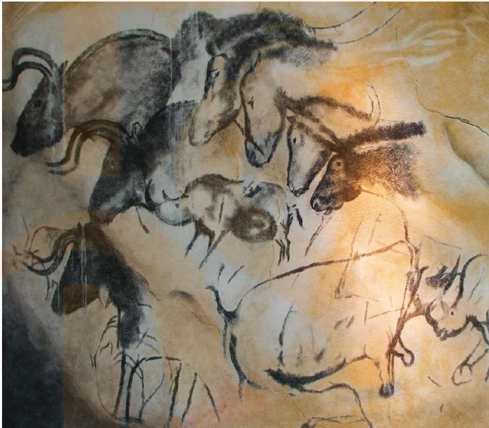
Figura 1: Rèplica de la pintura de la cova Chauvet-Pont-d'Arc al sud de França (Museu Anthropos, Brno)