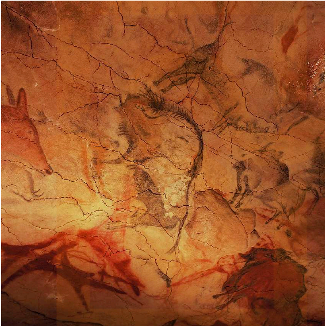
Figura 7: Bisons en el sostre de la cova.

Les pintures rupestres de la cova d'Altamira se situen la seva realització en l'època del Paleolític superior (18.000 - 14.000 anys del moment present). Si bé hi ha pintures en la major part de la cova, el conjunt principal de figures policromes està concentrat en un ampli sostre de 100 m2 de superfície que no arriba als 2 metres d'alçada: vint bisons, un parell de cavalls, un cérvol i altres figures no tan ben conservades.