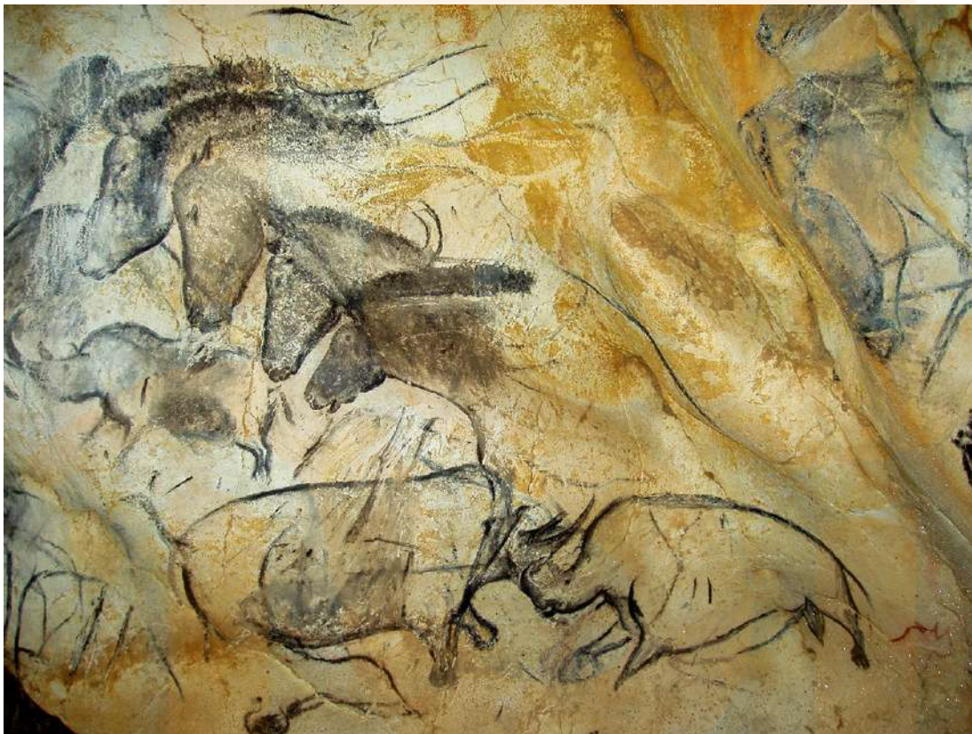
Figura 4: Panell de cavalls a la cova Chauvet-Pont d'Arc (Ardèche)