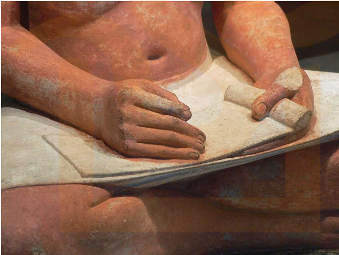
Figura 3: Detall de les mans de l'escriba assegut.

–[Dr. Zucker]: Hauríem sabut molt més sobre ell si la base en la qual està assegut no s'hagués perdut. Probablement hi hauria inclòs originalment el seu nom i títols.