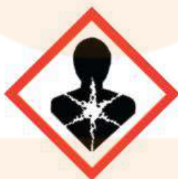
GH508 Health Hazard