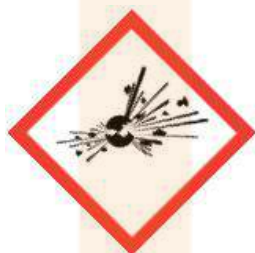
GH501 Exploding Bomb

Els nous pictogrames ( 9 símbols en forma de rombe amb fons blanc i la vora vermella ) substitueixen els anteriors (7 símbols en forma de quadrat de color taronja).