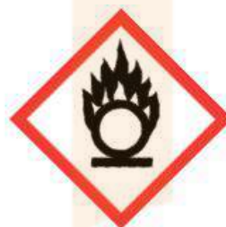
GH503 Flame over Circle