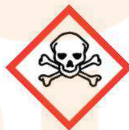
GH505 Skull and Crossbones