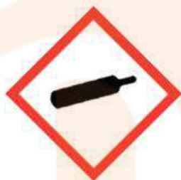
GH504 Gas Cylinder