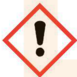
GH507 Exclamation Mark