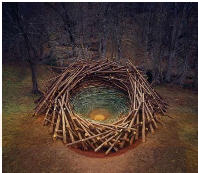
Nils-Udo. Niu. Terra, pedres, branques de bedoll i herba. Alemanya 1978.