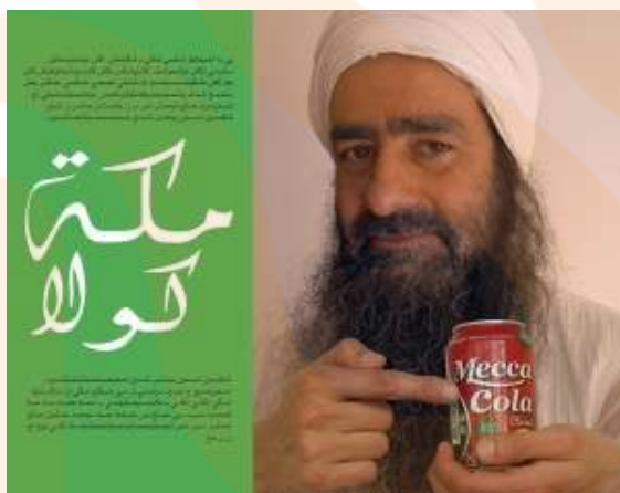
Imatge de la sèrie "Deconstruir ossama", Joan fontcuberta.

Pertany a la darrera generació de fotògrafs de la imatge analògica i els processos fotoquímics. Procedent del món de la publicitat, ha dedicat bona part de la seva obra a fer imatges que ens parlen de la fotografia com a transmissora de veritat o d'engany. Ha estat recent guanyador de l'edició del 2013 del considerat Nobel de la fotografia: el premi Hasselblad .