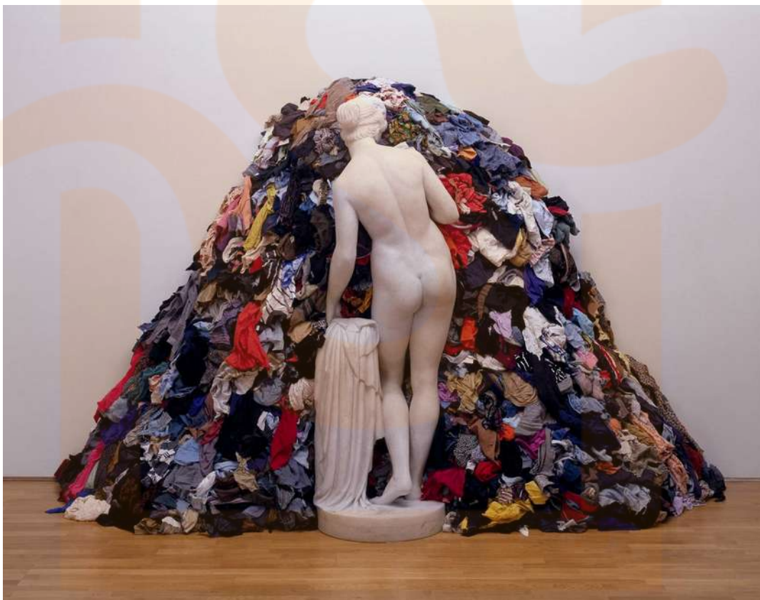
Michelangelo Pistoletto. Venus of Rags. 1967.

Les obres cerquen la reflexió de l'espectador sobre els materials, les seves característiques, les seves transformacions i el seu significat.