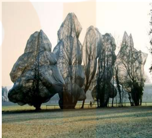
Christo&Jeanne-Claude. Arbres enbolcallats. 1998.

Illes envoltades, a Biscane Bay, Florida. 1983. (durant 15 dies)