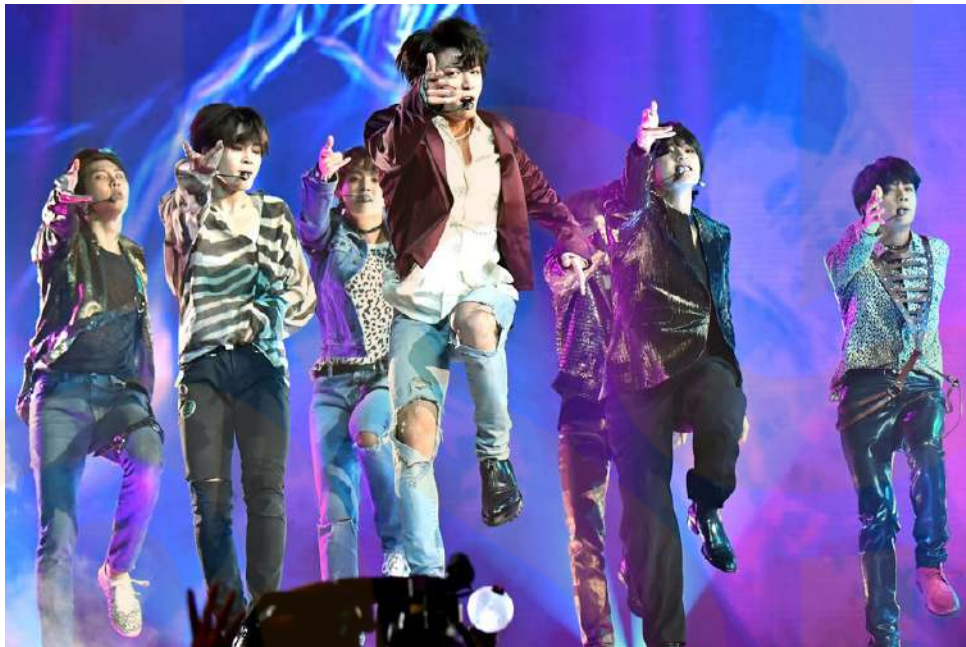
Imatge publicada a https://www.rollingstone.com/ "How K-Pop Conquered the West"

Text extret de: https://www.elnuevodiario.com "La música popular contemporánea"