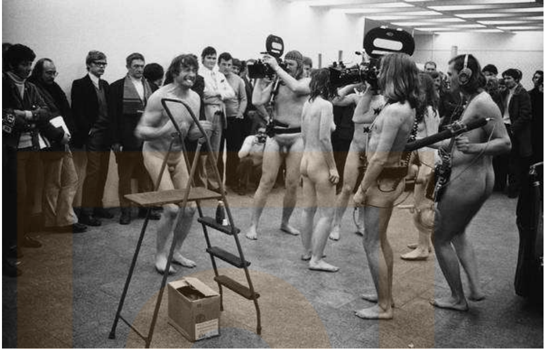
Happening del gup Fluxus.