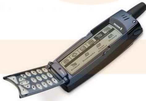
De la marca sueca Ericson, el R380 va ser considerat el primer smartphone.

Des dels anys 90 entrem a una nova era caracteritzada per les INFOCOMUNICACIONS, amb internet com a eina global.