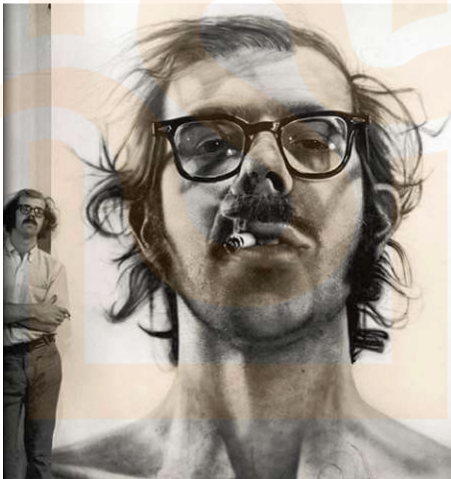
Big Self-Portrait. Chuck Close. Pintura acrílica sobre tela.