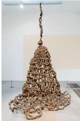
Trappola, de Pino Pascali (1968)

branques, fullaraca, fragments de metall o vidre. i materials humils, en brut, o deixalles (robes, vegetals, pedres, metalls, vidres, etc.). Es pretén trasbalsar el mercat de l'art utilitzant obres sense cap valor artístic. Sobresurten els italians Piero Manzoni (1933-63) i Michelangelo Pistoletto, i el grec Jannis Kounellis.