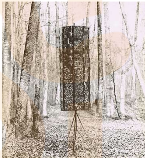
Perejaume. Postaler. 1984