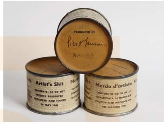
Piero Manzoni. Merda d'artista. 1961.