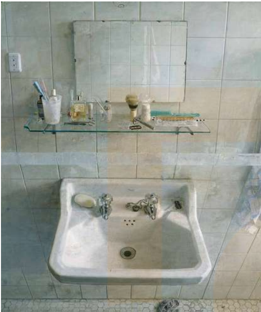
Antonio Lòpez. Pica i mirall. Oli sobre tela. 1967. © Antonio Lòpez, VEGAP, Madrid, 2016

A Europa el Grup Zebra alemany i el pintor espanyol Antonio Lòpez següen aquesta tendència.