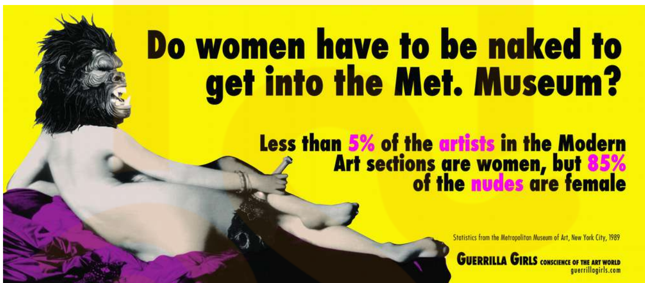
Guerrilla Girls, Do Women Have to Be Naked to Get Into the Met. Museum?, 1989. Poster.

Proliferació de les entitats de col·laboració supranacional sense ànims de lucre: ONG's.