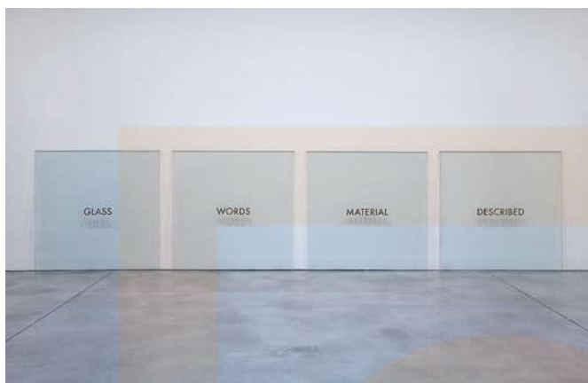
Joseph Kosuth, imatge d'una obra de l'exposició titulada "Ni l'aspecte ni il·lusió". Nova York, 2008.

A l'art conceptual els creadors consideren que la idea i els seus aspectes intel·lectuals són l'essència de l'obra. L'obra física és només un instrument per a la reflexió. L'artista és un elaborador de propostes i plantejaments filosòfics i lingüístics sobre l'art. Manifestacions d'aquest seran les variants de l'art d'acció, performances, happenings o body art.