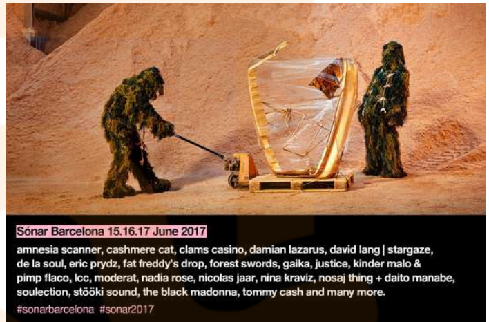
Imatge promocional del festival Sonar, 2017