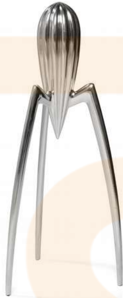
Exprimidor de Philippe Stark (1990)

Anys 80-2000: imaginació, sentit lúdic i tecnologia. Com a contrapartida a la qualitat es desenvolupa el Kitsch, amb elements estètics tradicionals fabricats amb materials barats per crear il·lusió de sofisticació (per exemple, les esferes de plàstic nevades).