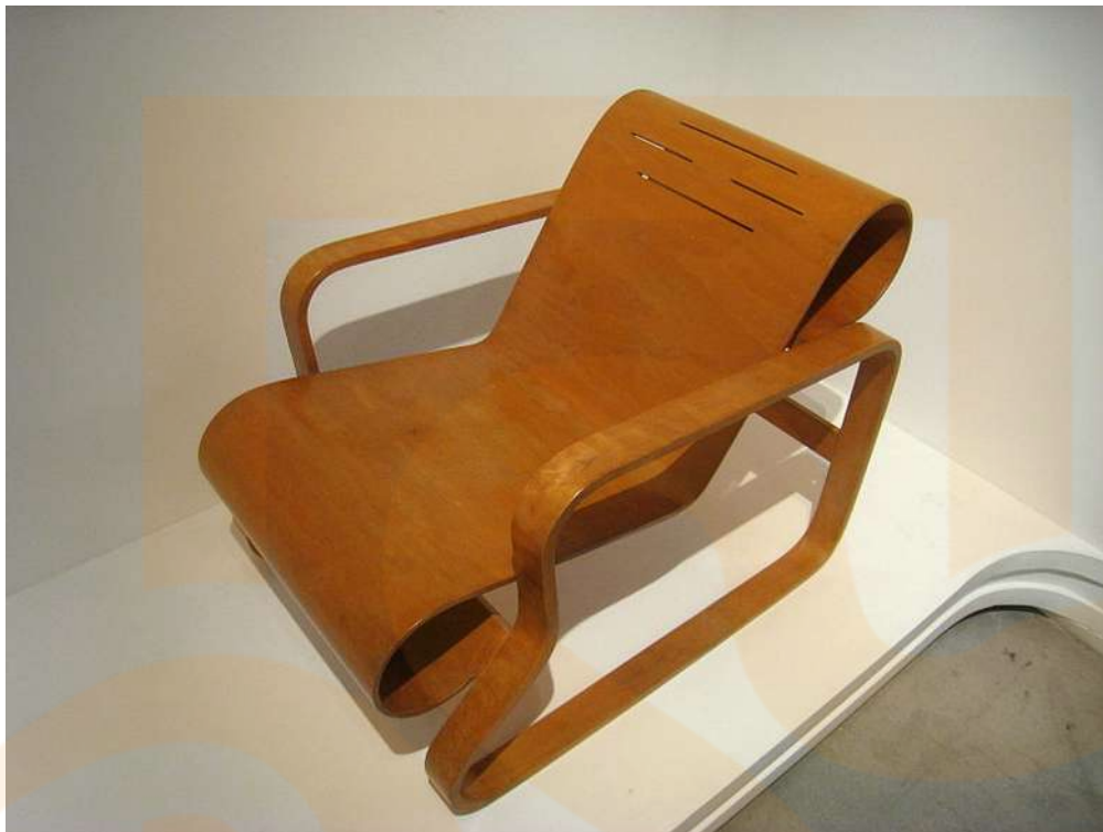
Poltrona 41. Alvar Aalto. 1929-33

A partir dels anys 39-50: línia senzilla, funcional, accessible i de qualitat derivada de les tendències racionalistes (Bauhaus) amb potenciació de l'atractiu disseny de consum a EE.UU.