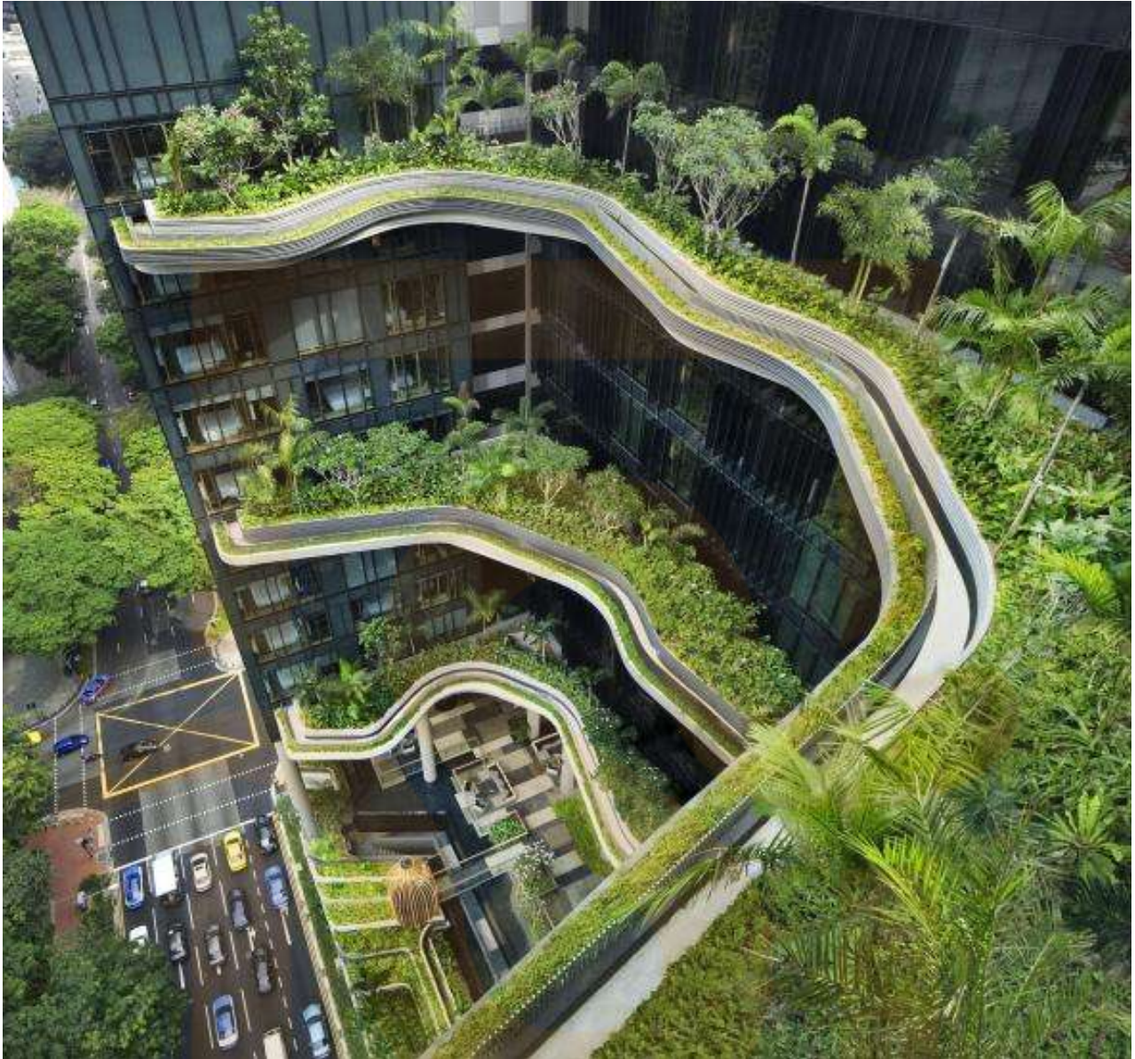
Agora- Garden. Edificio ADN. Taiwan, Taipei. Vincent Callebaut,