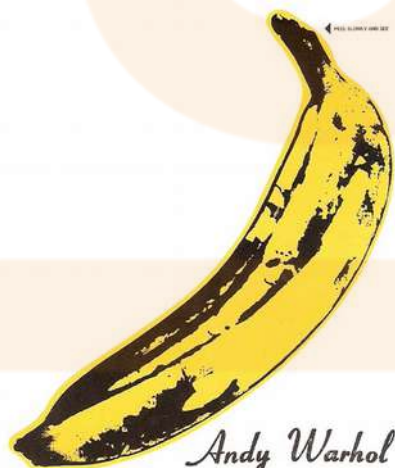
Portada de The velvet underground. D'Andy Warhol. 1967.

Neix als estats units durant els anys 40. Es dirigeix a esdeveniments (cartells), noves indústries com la discogràfica (caràtules de discos), publicitat i identitat corporativa com a icona de referència (disseny de logotips).