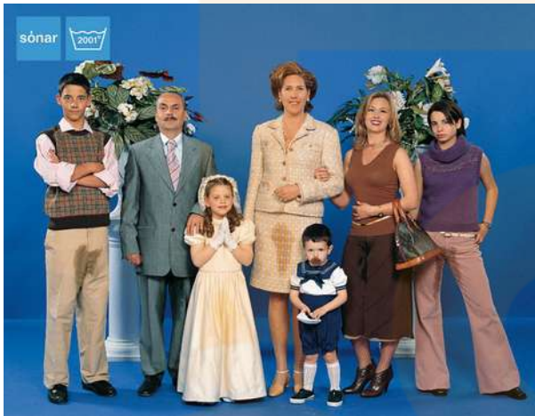
Imatge promocional del festival Sonar, 2001.

Lluny dels tòpics que tradicionalment han servit de targeta de presentació a la cultura electrònica, la imatge de Sónar aposta per la sorpresa, la singularitat i un marcat sentit de l'humor no exempt de polèmica que s'ha convertit en marca i icona del festival.