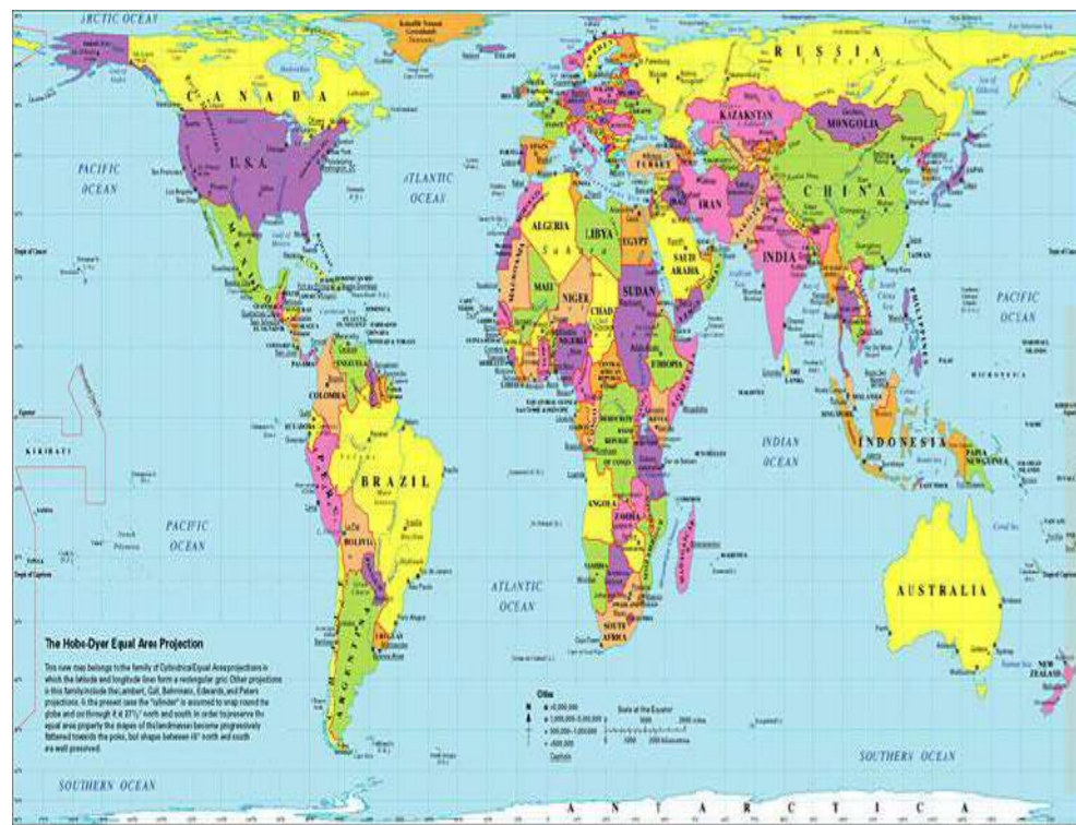
The Hobo-Dyer Equal Area projection (above) shows each country's area at true proportion. This makes it fair to all countries. Other ways of seeing the world include: (1) Buckminster Fuller's Dymaxion Map, (2) the Eckert II projection, (3) Leonardo da Vinci's mappamundi, and (4) a population carogram. For more information on these images visit www.odt.org/hdp