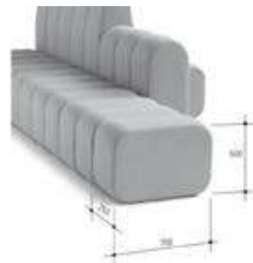
IMATGE I. Mides dels mòduls del sofà (expressades en mil·límetres)