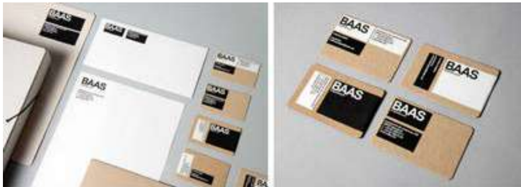
IMATGE D. Alguns exemples de com es poden marcar diferents elements de papeteria amb el sistema d'etiquetes autoadhesives

En la imatge D podem observar un sistema d'etiquetes autoadhesives desenvolupat pel dissenyador gràfic Héctor Sos. Gràcies a aquest sistema, l'empresa Baas Architecture pot aplicar aquestes etiquetes sobre qualsevol material o suport.