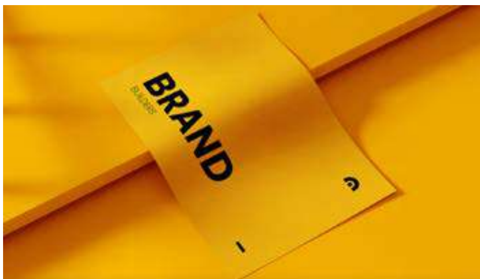
IMATGE E. Mostra de la imatge de marca de Brand Builders

L'estudi de disseny Brand Builders necessita un cartell per a anunciar una conferència sobre disseny gràfic. En la imatge E, podem observar els trets fonamentals de l'estil gràfic d'aquest estudi.