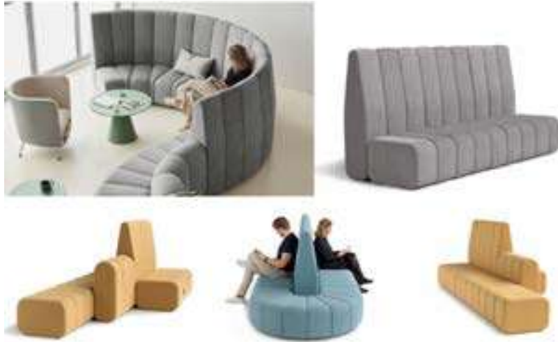
IMATGE F. Sistema modular de sofàs BOB (2021), de Blå Station, dissenyat per Thomas Bernstrand i Stefan Borselius

En la imatge F es mostra el sistema modular de sofàs BOB, de l'empresa Blå Station.