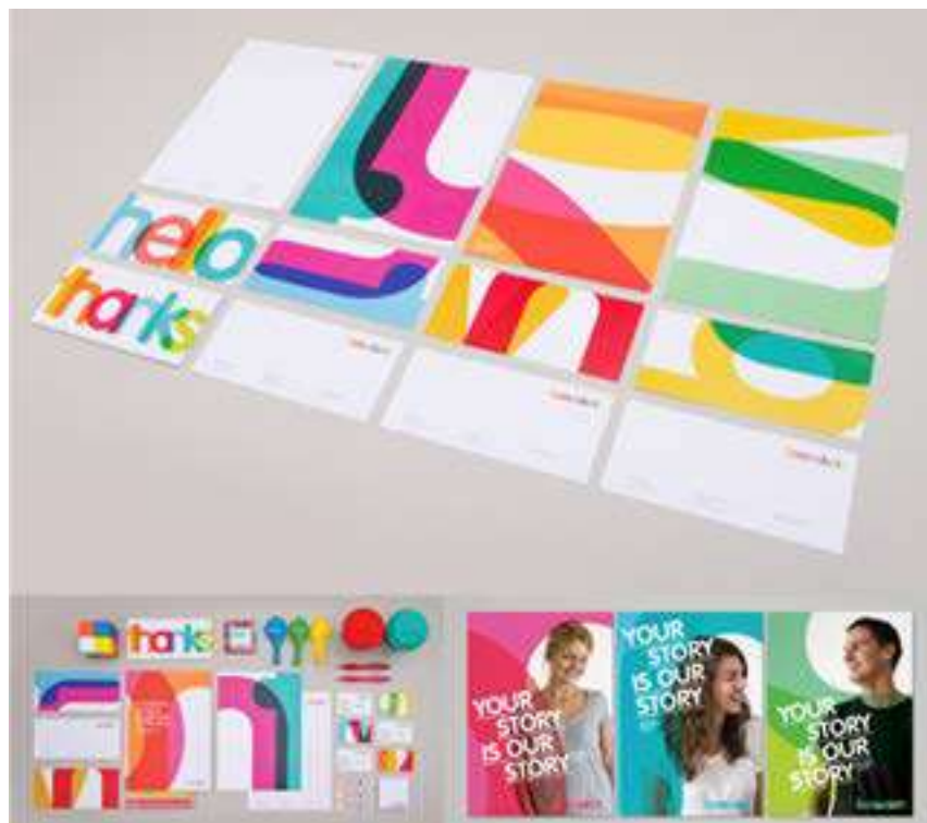
IMATGE A. Fragments de la imatge visual corporativa de Benevolent Society, dissenyada per l'estudi Designworks (Austràlia)

En la imatge A podem observar la imatge visual corporativa de Benevolent Society, la primera organització benèfica que es va fundar a Austràlia. Aquesta entitat promou el canvi social treballant a partir de la construcció de famílies fortes, implicant les persones amb les comunitats a les quals pertanyen perquè aquestes comunitats siguin saludables.