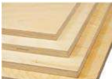
IMATGE H. Material per a realitzar la tauleta: fusta contraplacada de bedoll de 9 mm

Aprofitant que es poden encastrar altres materials entre els mòduls, dissenyeu una tauleta auxiliar de fusta que s'hi pugui encaixar manualment i mantingui l'harmonia amb aquest tipus de mobiliari. Utilitzeu la informació proporcionada en les imatges H i I.