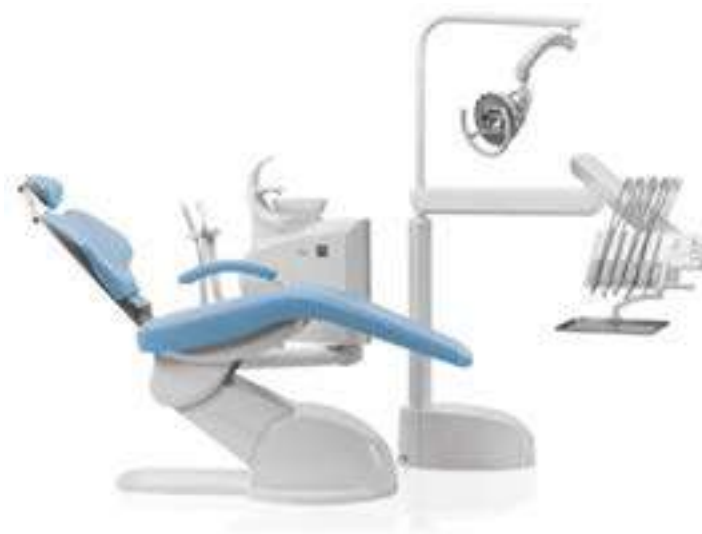
IMATGE C. Seient i unitat de consulta odontològica DC310 (2019), de Diplomat Dental