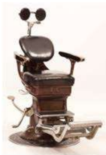
IMATGE B. Seient de consulta odontològica A609.1 (1907), de l'empresa SS White Dental, exposada al Ward Museum