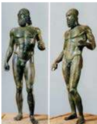
1. Guerrers de Riace

e) Ordeneu cronològicament, de més antiga (1) a més recent (4), les obres següents. Per fer-ho, escriviu els números corresponents a les caselles que hi ha a sota de les imatges. (Cal que completeu tota la seqüència. En cas contrari, l'apartat no serà puntuat.)