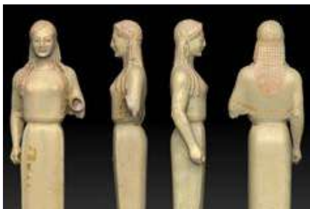
3. Kore del pèplum