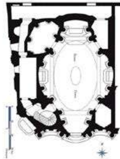
Església de San Carlo alle Quattro Fontane (Roma), de Francesco Borromini