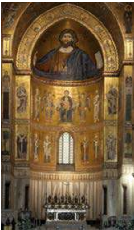
Catedral de Monreale

e) Compareu aquests dos conjunts artístics del romànic i esmenteu dues similituds i dues diferències entre ells.