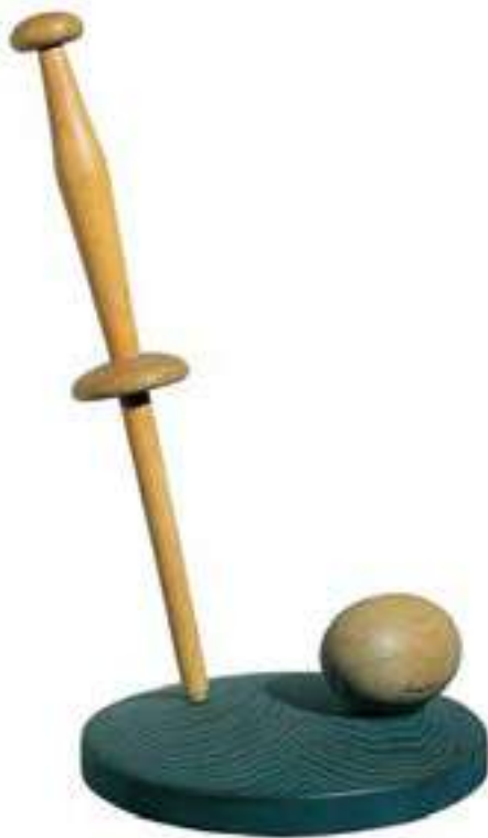
Nit de lluna , de Leandre Cristòfol (Barcelona, MNAC)