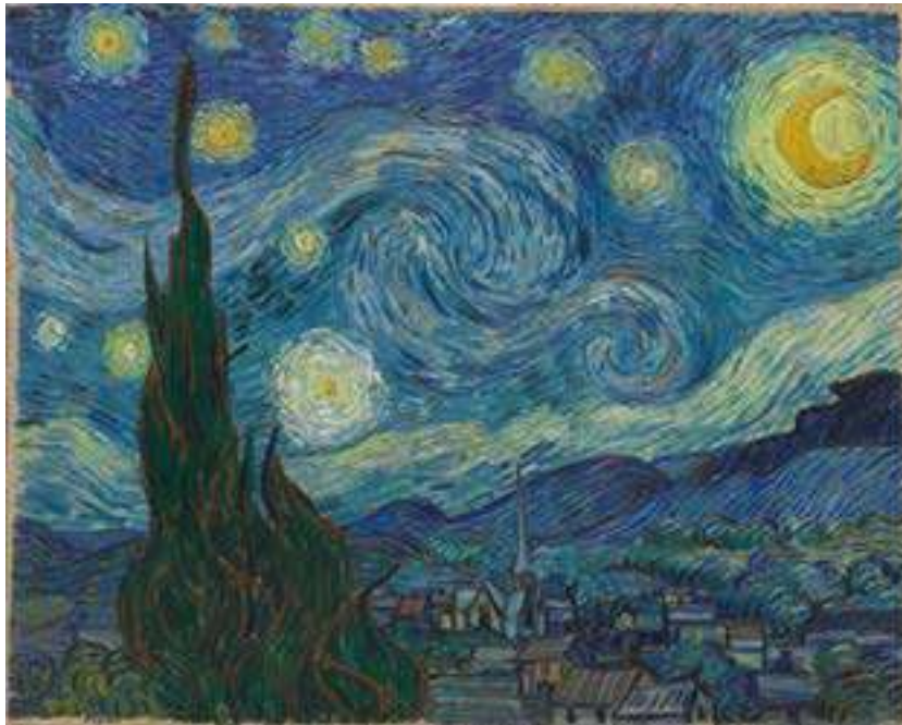
La nit estrellada , de Vincent van Gogh (Nova York, MoMA)