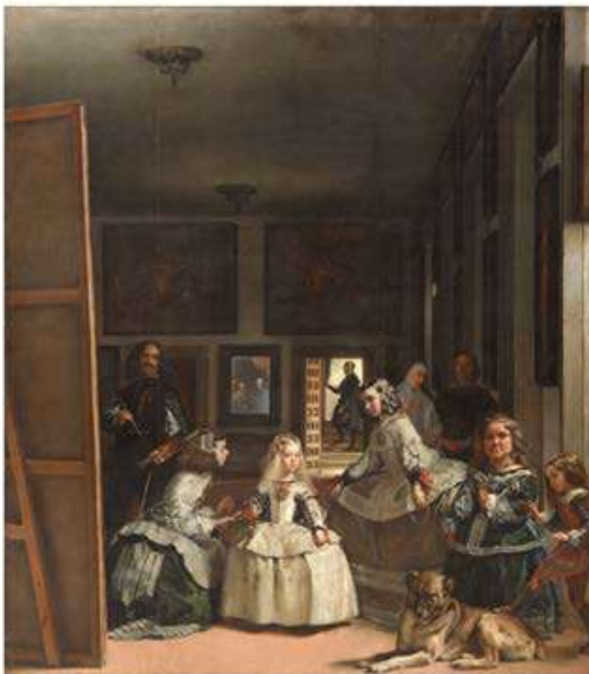
Las Meninas o La familia de Felip IV, de Velázquez

a) Dateu l'obra i situeu-la en el context històric i cultural corresponent.