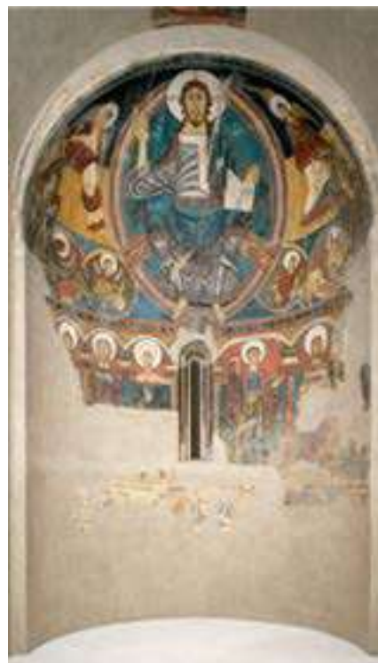
Església de Sant Climent de Taüll