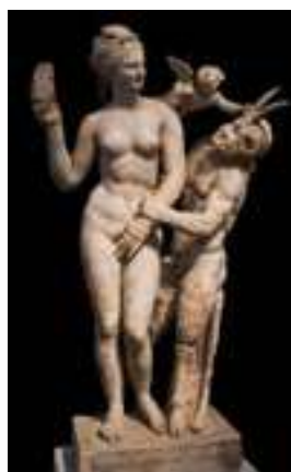
2. Afrodita, Pan i Eros