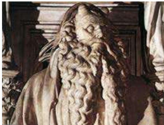
Pou de Moïses , de Claus Sluter

a) Dateu l'obra i situeu-la en el context històric i cultural corresponent.