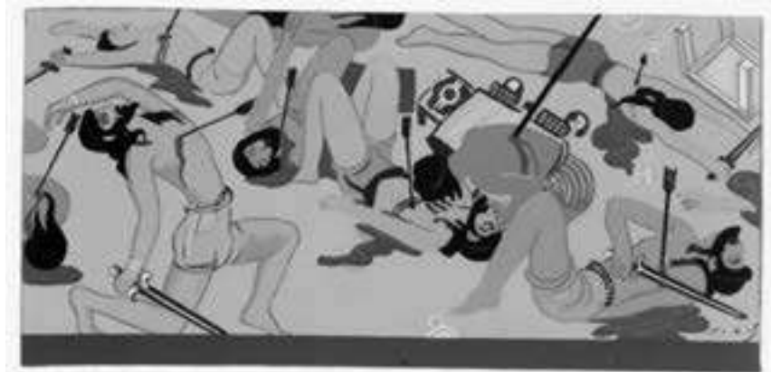
Il·lustració de François-Louis Schmied per a L'Odyssée (1928)